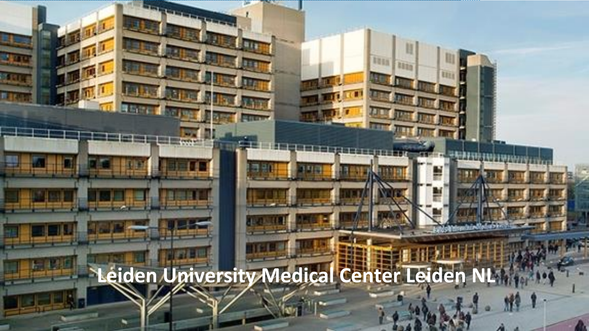
Leiden University Medical Center Leiden NL