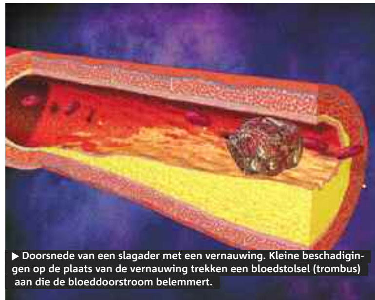
► Doorsnede van een slagader met een vernauwing. Kleine beschadigingen op de plaats van de vernauwing trekken een bloedstolsel (trombus) aan die de bloeddorstroom belemmert.